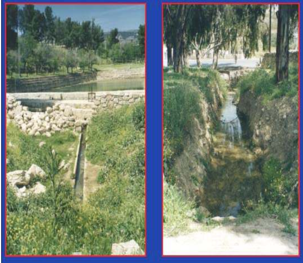
Plate (Photo) 1. A Photo of Qantara Spring Watershed